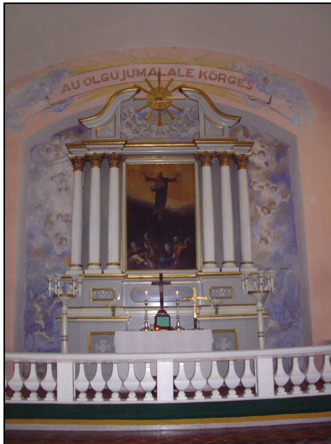
Paide kiriku altar.