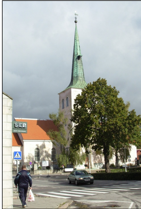
Paide kirik.

Agaga väiksele inimhulga- le, enamasti vaestele lihtini-