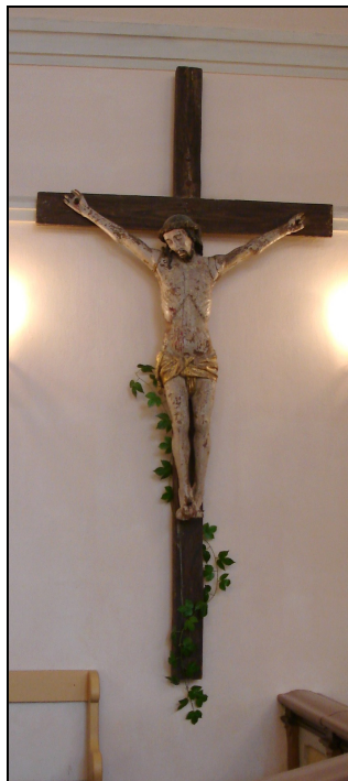
Krutsifiks Rapla kirikus.

givalla all, hädades, tagakiusamistes ja ahistustes Kristuse pärast, sest kui ma olen nõder, siis ma olen vägev."