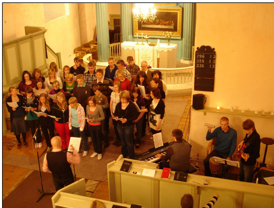
Noortekoor Evangelicum Lääne-Nigula kirikus 22.5.2009.