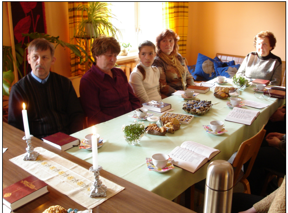
Usk tuleb kuulutusest, kuulutus aga Kristuse sõna kaudu. Koguduseõhtu Kärus.

Paulus oli jõudnud veendumusele, millele peavad jõudma kõik inimesed: et meid võib teha õndsaks ainult Jeesuse poolt meile kingiks hangitud pääste. See kingitus on meil evangeeliumi