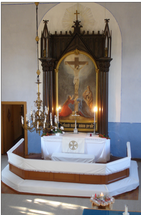
Käru kiriku altar.